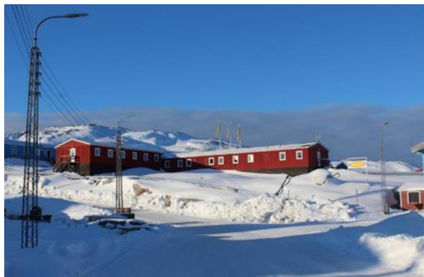
Illup pingaarnerup ilaa / Anneks B-872 aqquserngit naapiffiinit isigalugu / set fra vejkyrset.