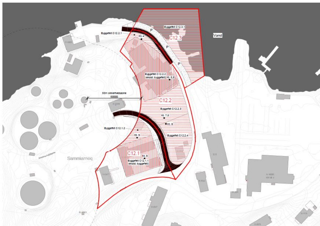
Baggrund/placering for koter i bilag 2