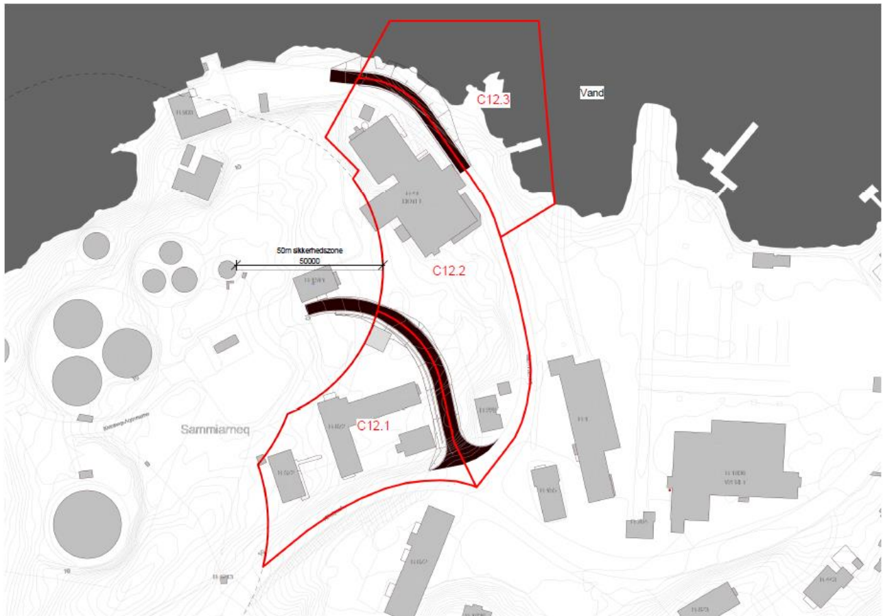
Bilag 3: Fremtidige vejforløb & underopdeling af detailområdet