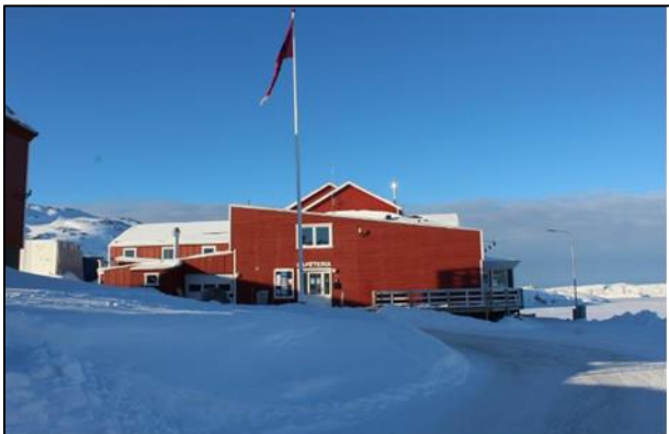
Umiartortut angerlarsimaffiata pingaarnertut illutaa / Søndshjemmets hovedbygning