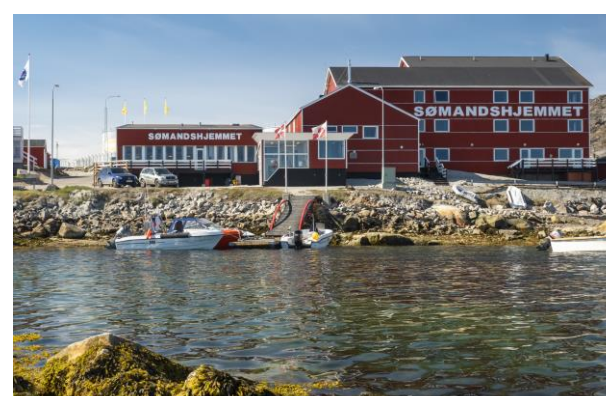
Umiartortut angerlarsimaffiata umiarsualivimmu sammerna / Søndshjemmets havnefront