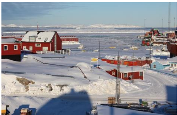
Illup pingaarnerup ilaanit isikkivik / Udsigt til anneks B-229 aqquserngit naapiffiata avannatungaaniit / liggende nord for vejkyrset.