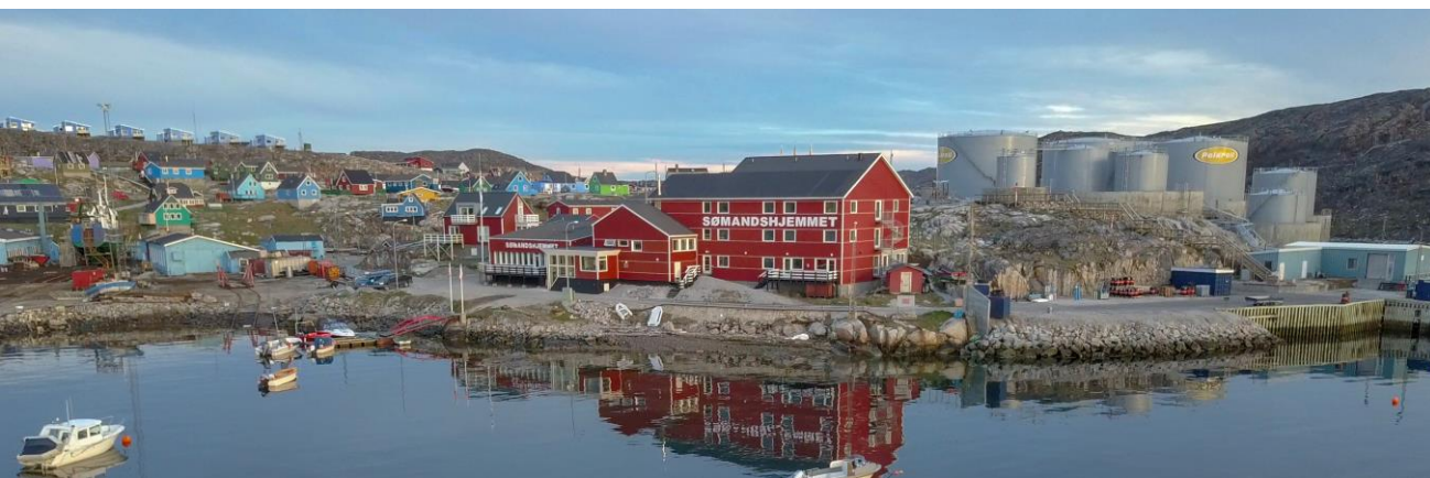
Tankegarfiup umiarsualiviullu Umiartortut angerlarsimaffiannut attuumassuteqarneranik assliaq takussutis-siisoq / Oversigts billede visende relationen af tankanlæggende og havnen til Søndshjemmet